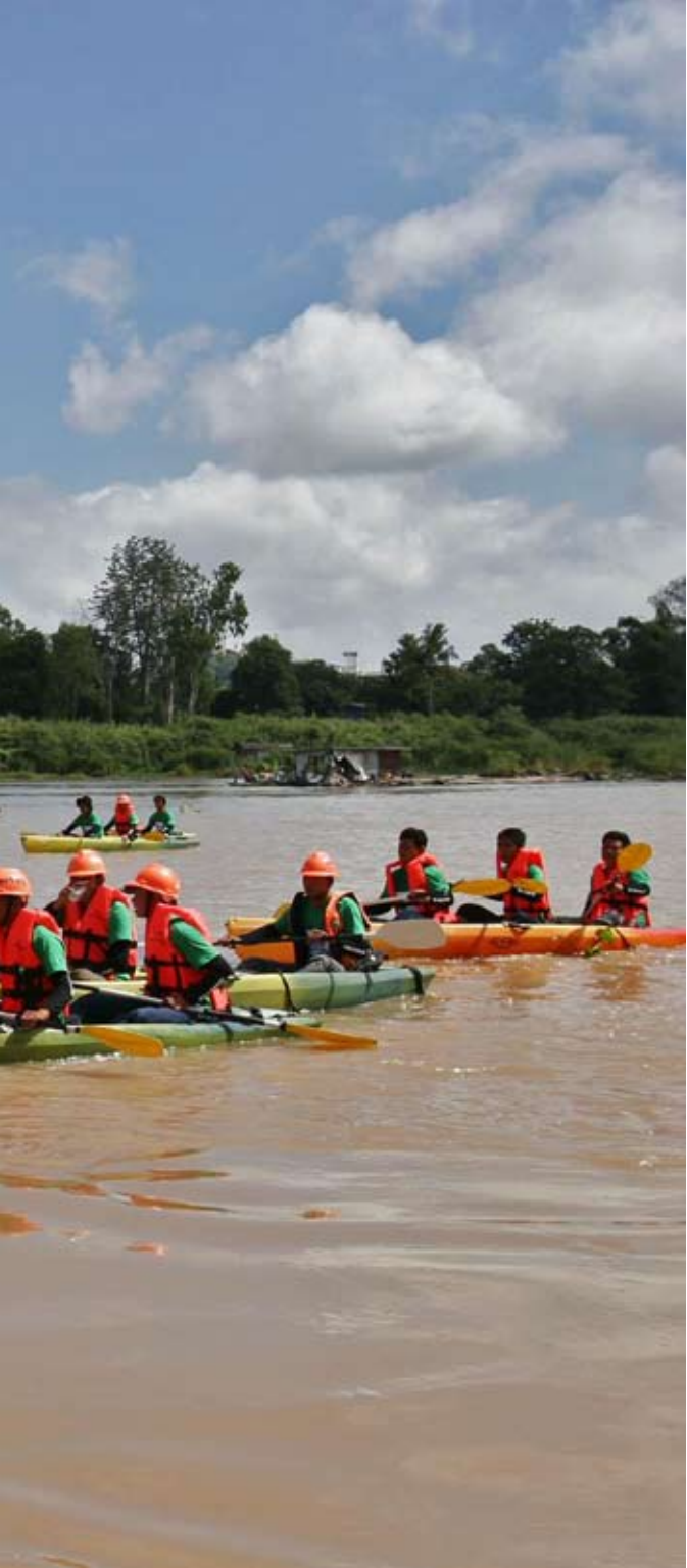
โครงการสืบรอยยืมสู่สายน้ำเจ้าพระยาปลอดมลพิษ, ประเทศไทย, พฤษภาคม 2552

เมื่อต้นปี พ.ศ. 2552 กรีนพีซเปิดเผยรายงานสรุปผลการศึกษา “พื้นที่และแหล่งน้ำที่เสี่ยงต่อการเกิดมลพิษทางน้ำในประเทศไทย” รวมทั้งมีการนำเสนอข้อมูลระดับความเสี่ยงในเชิงแผนที่ ซึ่งผลการศึกษาดังกล่าวชี้ให้เห็นว่าประมาณร้อยละ 93 ของพื้นที่ประเทศไทย เป็นพื้นที่เสี่ยงต่อปัญหามลพิษทางน้ำ ทั้งนี้ ร้อยละ 7 ของพื้นที่เหล่านี้จัดอยู่ในประเภทพื้นที่ที่มี “ความเสี่ยงสูง” ซึ่ง หากไม่มีการดำเนินการป้องกันแก้ไขโดยทันทีอาจผลกระทบต่อประชากรไทยกว่าสี่ล้านคน