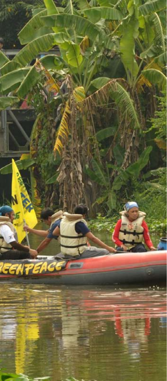
วันแห่งการรณรงค์ปกป้องชายฝั่งบนนาซาดิ, จังหวัดลากูนา, ประเทศฟิลิปปินส์, กันยายน 2552

ในประเทศฟิลิปปินส์ การรณรงค์ของกรีนพีซร่วมกับเครือข่ายอย่างต่อเนื่องเป็นเวลาหลายเดือนเพื่อให้รัฐบาลจัดการกับปัญหาและทำความสะอาดพื้นที่ลึกลับทั้งชายฝั่งที่ ไตไต ริมฝั่งทะเลสาบลากูนา (Laguna Lake) ส่งผลให้รัฐบาลต้องใช้มาตรการทางสิ่งแวดล้อมที่เข้มงวดขึ้น นอกจากนี้ ในเดือนตุลาคมกรีนพีซมีกิจกรรมรณรงค์ตอบสนองอย่างเร่งด่วนต่อปัญหามลพิษที่เกิดกับแม่น้ำนังกา (Nangka) ที่ซึ่งรัฐบาลท้องถิ่นใช้เป็นที่ทิ้งขยะโดยผิดกฎหมาย ส่งผลให้รัฐบาลฟิลิปปินส์ยอมทำความสะอาดแม่น้ำสายดังกล่าว ทั้งนี้ ในปลายเดือนตุลาคม กรีนพีซได้เปิดโปงกรณีที่โรงงานกำจัดขยะแห่งหนึ่งที่ปล่อยให้สารเคมีอันตรายรั่วไหลออกจากพื้นที่โรงงานและปนเปื้อนลำธารใกล้เคียงที่ไหลลงสู่ทะเลสาบลากูนา เป็นผลให้โรงงานกำจัดขยะดังกล่าวถูกปิดชั่วคราวและนำไปสู่การปฏิบัติตามข้อเรียกร้องของกรีนพีซ