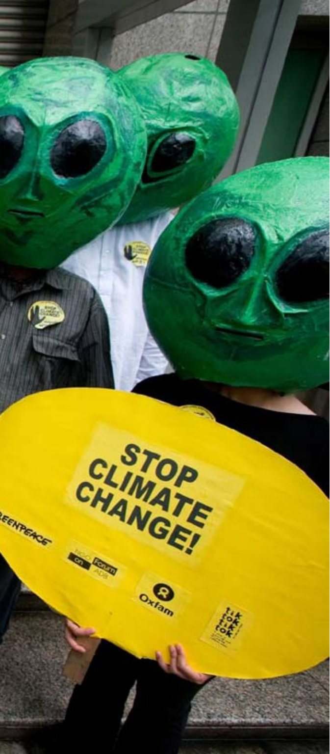
“มนุษย์ต่างดาว” หน้าราชการเพื่อการพัฒนาแห่งเอเชีย (ADB), กรุงเทพมหานครฟิลิปปินส์, มิถุนายน 2552

งานรณรงค์ของกรีนพีซเพื่อลด ละ เลิกการใช้ถ่านหินในฐานะเป็นทางออกของวิกฤตสภาพภูมิอากาศได้ดำเนินสืบเนื่องมาเป็นอย่างดีในประเทศไทยและฟิลิปปินส์ ในเดือนกุมภาพันธ์ พ.ศ. 2552 เราเริ่มต้นปีด้วยการขยายงานรณรงค์เพื่อยุติถ่านหินในอินโดนีเซีย โดยทำงานกับแนวร่วมยุติการสร้างโรงไฟฟ้าถ่านหินแห่งใหม่และการขยายโรงไฟฟ้าถ่านหินที่มีอยู่ในอินโดนีเซีย ก้าวแรกของการรณรงค์ เริ่มต้นที่การนำเสนอรายงาน “ต้นทุนที่แท้จริงของถ่านหิน” และกิจกรรมรณรงค์โดยไม่ใช้ความรุนแรงได้รับการสนับสนุนและตอบรับจากชุมชนและผู้นำท้องถิ่นเป็นอย่างดี