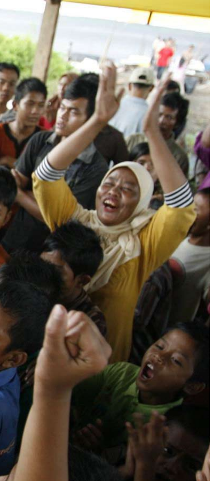
ชุมชนสนับสนุนค่ายที่กักตุนสภาพภูมิอากาศในคาบสมุทรกัมปาร์ ประเทศอินโดนีเซีย, พฤศจิกายน 2552

ชุมชนท้องถิ่นในคาบสมุทรกัมปาร์ทำงานเคียงบ่าเคียงไหล่กับนักกิจกรรมของกรีนพีซจากอินโดนีเซียและจากทั่วโลกในการสร้างค่ายผู้พิทักษ์ป่าเพื่อปกป้องสภาพภูมิอากาศขึ้น และยังร่วมกันสร้างฝายเพื่อกั้นไม่ให้ระบายน้ำออกจากป่าพรุได้ ทั้งนี้ การขุดคลองเพื่อระบายน้ำออกจากพื้นที่ป่าพรุเป็นวิธีการที่อุตสาหกรรมเกษตรใช้ในการถางพื้นที่ป่าโบราณเพื่อเตรียมปลูกปาล์มน้ำมัน กิจกรรมดังกล่าวถือเป็นความสำเร็จในการป้องกันไม่ไห้ก๊าซเรือนกระจกนับล้านตันที่ถูกกักไว้ในป่าพรุแห่งนี้ด้วยกระบวนการทางธรรมชาติ ถูกปล่อยออกสู่ชั้นบรรยากาศ