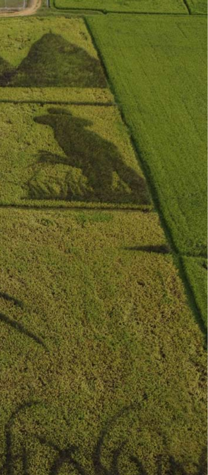
ภาพถ่ายทางอากาศของ “ภาพศิลปะบนนาข้าว” ที่จังหวัดราชบุรี, ตุลาคม 2552

ประเทศไทยมีวัฒนธรรมชุมชนชนกสิกรรมเป็นพื้นฐานหยั่งรากลึก ชาวนาถือเป็นกระดูกสันหลังของชาติ ในเดือนมกราคม พ.ศ. 2552 กิ เนสส์ เวิลด์ เรคคอร์ด (Guinness World Records) ได้ประกาศให้ ประเทศไทยเป็นประเทศผู้ส่งออกข้าวมากที่สุดในโลก คิดเป็นส่วน แบ่งร้อยละ 27 ของปริมาณข้าวที่มีการซื้อขายทั้งหมดในตลาดโลก ภายหลังจากที่กรีนพีซ ได้นำสถิติการส่งออกข้าวของประเทศไทยเสนอ ต่อกิเนสส์ เวิลด์ เรคคอร์ดจนนำมาซึ่งความภาคภูมิใจแก่คนไทย