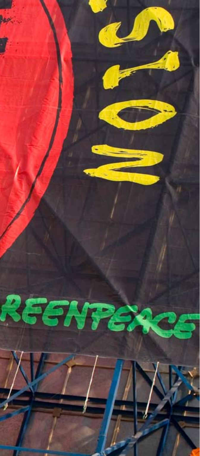
กิจกรรมรณรงค์ การประชุมสุดยอดผู้นำอาเซียน, หัวหิน, กุมภาพันธ์ 2552

เอเชียตะวันออกเฉียงใต้เป็นหนึ่งในภูมิภาคที่ต่อแผลมมากที่สุดและมีความพร้อมน้อยที่สุดในการรับมือกับผลกระทบจากการเปลี่ยนแปลงสภาพภูมิอากาศที่เป็นอันตราย ประเทศไทย ฟิลิปปินส์ และอินโดนีเซีย จัดอยู่ในบรรดาประเทศที่จะได้รับผลกระทบมากที่สุดจากวิกฤตนี้ การรณรงค์ของกรีนพีซเอเชียตะวันออกเฉียงใต้ใน พ.ศ. 2552 จึงเน้นถึงทางออกของปัญหา โดยเฉพาะอย่างยิ่ง ปี 2552 เป็นช่วงเวลาที่ประชาคมโลกฝากความหวังไว้กับการประชุมสุดยอดว่าด้วยการเปลี่ยนแปลงสภาพภูมิอากาศของสหประชาชาติ ณ กรุงโคเปนเฮเกนในเดือนธันวาคม