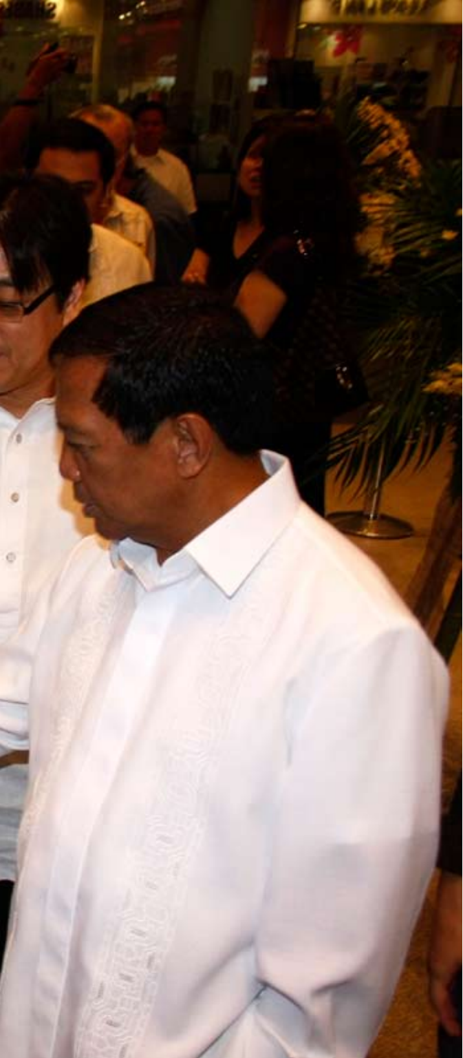
กิจกรรมรณรงค์ประหยัดพลังงานในเมืองมาคาคติ, ประเทศฟิลิปปินส์, กรกฎาคม 2552

ในช่วงเวลานี้เอง กรีนพีซเริ่มโครงการเยาวชนนักจรรยาวิชาเพื่อสิ่งแวดล้อมในประเทศไทย โดยมีเยาวชนที่สนใจทำหน้าที่เป็นจุดสิ่งแวดล้อมโดยเฉพาะอย่างยิ่งในประเด็นการเปลี่ยนแปลงสภาพภูมิอากาศ มาร่วมจรรยาวิชา ซึ่งออกอากาศทั่วประเทศอาทิตย์ละครั้ง ตั้งแต่เดือนกรกฎาคม ไปจนถึงสิ้นปี ขณะเดียวกันที่ประเทศฟิลิปปินส์ กรีนพีซก็เริ่มรณรงค์เชิงรุกเพื่อผลักดันให้เกิดมาตรการปรับปรุงประสิทธิภาพพลังงาน (Energy Efficiency) ซึ่งประสบความสำเร็จในการผลักดันให้เมืองมาคาคติ (Makati) ซึ่งเป็นศูนย์กลางธุรกิจของกรุงมะนิลา เมืองหลวงของฟิลิปปินส์ ให้คำมั่นที่จะลดสภาพภูมิอากาศกับกรีนพีซ ว่าจะเป็นเมืองแรกในภูมิภาคเอเชียตะวันออกเฉียงใต้ที่นำมาตรการต่างๆ เพื่อปรับปรุงประสิทธิภาพพลังงานมาใช้ในทุกด้าน (comprehensive energy efficiency measures) ความสำเร็จอีกประการของกรีนพีซในฟิลิปปินส์คือการที่การท่องเที่ยวฟิลิปปินส์ประกาศสนับสนุนโครงการ “ปกป้องสภาพภูมิอากาศ ปกป้องโบราไค” (Save the Climate, Save Boracay) ซึ่งเป็นโครงการที่เป็นผลมาจากการทำงานของกรีนพีซร่วมกับผู้ประกอบการต่างๆ ที่จะพัฒนาให้เกาะซึ่งเป็นแหล่งท่องเที่ยวสำคัญของประเทศได้เป็นมิตรกับสภาพภูมิอากาศ