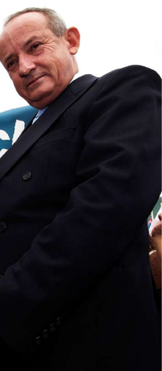
นายซีอีโอบาร์ เจอานที่ระดับสูงสุดเรื่องสภาพภูมิอากาศของสหประชาชาติ รับผิดชอบการประชุมและเด็กคนละน้อยเพื่อผู้ โลกร้อน (small change for the climate)" ที่มาจากการบรรจบกันระหว่าง การสร้างการเปลี่ยนแปลง, กรุงเทพฯ, กันยายน 2552

ตลอดเดือนกันยายน กรีนพีซในประเทศไทยจัดงานรณรงค์ “เดินกับช้าง ร่วมสร้างการเปลี่ยนแปลง” (Chang[e] Caravan) ระยะทาง 200 กิโลเมตร จากอุทยานแห่งชาติเขาใหญ่ซึ่งเป็นหนึ่งในมรดกโลกไปตามรอยต่อของ ผืนป่าและพื้นที่ลุ่มน้ำในภาคกลางของประเทศเข้าสู่กรุงเทพมหานคร โดยมีเป้าหมายเพื่อยกระดับความตระหนักและความจำเป็นในการหา ทางออกจากวิกฤตสภาพภูมิอากาศร่วมกัน ทั้งนี้ เรื่องราวต่างๆ ที่เราได้รับ ฟัง รวบรวมและเป็นประจักษ์พยานถึงการความหลากหลายทางชีวภาพที่ ถูกคุกคาม การทำลายป่าไม้ วิกฤตน้ำ การรุกของน้ำเค็ม และการกักเซาะ ชายฝั่งจากการเพิ่มขึ้นของระดับน้ำทะเล ได้นำมาสร้างเป็นเวทีสาธารณะ ในการเรียกร้องความเป็นธรรมให้กับชุมชนที่ได้รับผลกระทบจากการ เปลี่ยนแปลงสภาพภูมิอากาศทั่วภูมิภาคเอเชียตะวันออกเฉียงใต้ ใน ระหว่างการเดินทาง กรีนพีซจัดให้มีการกล่าวสุนทรพจน์โดย โอบามา หนานาเหมือิน(Faux-bama) ซึ่งเป็นชาวอินโดนีเซียที่มีหน้าตาคล้ายคลึงกับ ประธานาธิบดีของสหรัฐอเมริกา กิจกรรมดังกล่าวดึงดูดความสนใจของสื่อ ทั่วโลกมายังสารที่กรีนพีซต้องการส่งถึงผู้นำประเทศต่างๆ ของโลกต่อ ความสำคัญที่พวกเขาเหล่านั้นควรต้องเข้าร่วมการประชุมสุดยอดด้วย การเปลี่ยนแปลงสภาพภูมิอากาศ ณ กรุงโคเปนเฮเกน