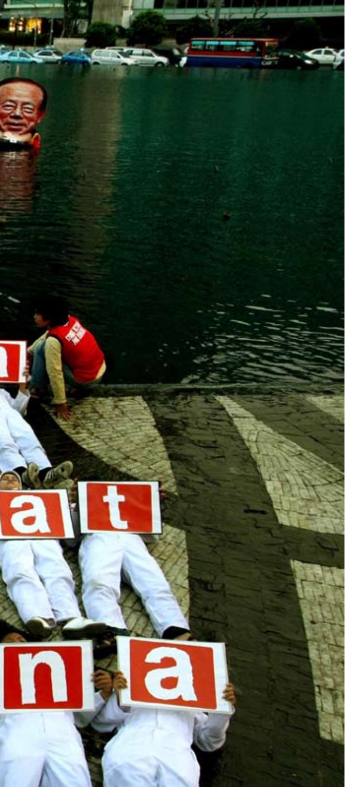
กิจกรรมเปิดตัวโครงการ Tck tck tck กรุงเทพมหานครโตเป็นเตี้ย, สิงหาคม 2552

ในเดือนสิงหาคม กรีนพีซ เอเชียตะวันออกเฉียงใต้ ร่วมเปิดตัวโครงการรณรงค์ tck tck tck หรือ “ตึกตอก ตึกตอก” ในภูมิภาคด้วยกิจกรรมต่างๆ ในกรุงเทพฯ จาการ์ตา และมะนิลา ภายใต้แนวร่วมปฏิบัติการด้านสภาพภูมิอากาศโลก(GCCA: Gobar Campaign for Climate Action) ซึ่งเป็นความร่วมมือระหว่างองค์กรภาคประชาสังคมและองค์กรพัฒนาเอกชนจำนวนมาก ทั้งระดับชาติและสากลซึ่งทำงานด้านสิ่งแวดล้อม ขจัดความยากจน ความเท่าเทียมในสังคม ความเสมอภาคทางเพศ และสิทธิมนุษยชน เพื่อเรียกร้องให้รัฐบาลทั่วโลกหันมาต้านสู้กับความท้าทายของการเปลี่ยนแปลงสภาพภูมิอากาศ