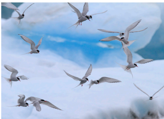
Arctic tern

I motsats till flera progressiva länder så har Sveriges regering varit väldigt passiv. Det har förekommit väldigt lite kommunikation om vilken ambition Sverige har, både gällande det globala havsskyddet och vad man vill få ut av FN-förhandlingarna. Det lilla som har presenterats är oroväckande, då den svenska utgångspunkten verkar vara inte att öka skyddet för livet i havet utan att snarare minimera förändringar i dagens regelverk.