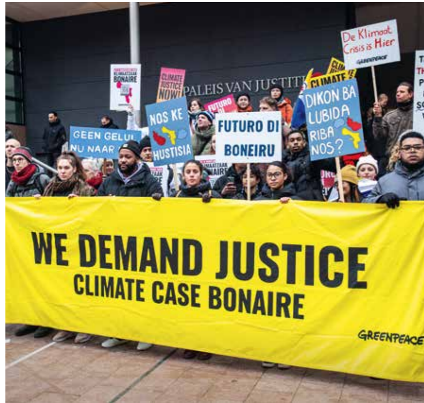
Protestmars van het Torentje naar de rechtbank in Den Haag in januari 2024.