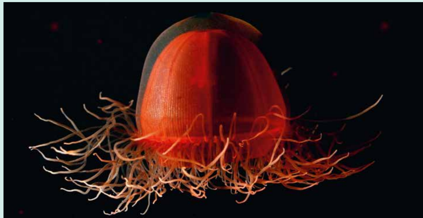
Greenpeace wil de wonderen van de diepzee beschermen, zoals deze prachtige volwassen kwal in de diepzee bij Alaska.

‘Sponzen zijn een van de oudste meercellige wezens die we kennen en belangrijk voor het reguleren van het waterleven. Mijn onderzoeksgroep had daarom een Europese beurs gekregen voor onderzoek naar het functioneren van sponzen in de diepzee. Na een jaar vroeg een EU-commissie of ik even kon komen vertellen hoe dat nou allemaal werkte, met die sponzen op de zeebodem. Ik wist in eerste instantie niet wat ik daarmee aan moest: het onderzoek staat nog zó in de kinderschoenen. Na enig wikken en wegen besloot ik precies dat te vertellen toen ik bij de commissie aanschoof. “Jullie verzoek”, begon ik mijn presentatie, “is eigenlijk alsof je aan iemand die gisteren het heelal ontdekt heeft, vraagt hoe het nou eigenlijk allemaal werkt, daar in de ruimte.” Mensen beseffen niet dat we echt zo'n 90% van al het water op de wereld nog niet kennen. Vooropgesteld: ik ben een wetenschapper en niet per se tegen diepzeemijnbouw. Maar ik vind het wél noodzakelijk om de gevolgen eerst van alle mogelijke kanten te onderzoeken. Alleen dan kom je erachter of dat ingrijpen ook op een minimaal invasieve manier kan gebeuren en of je er geen wezenlijke processen mee verstoort. Dat de mijnbouwindustrie al op het punt van