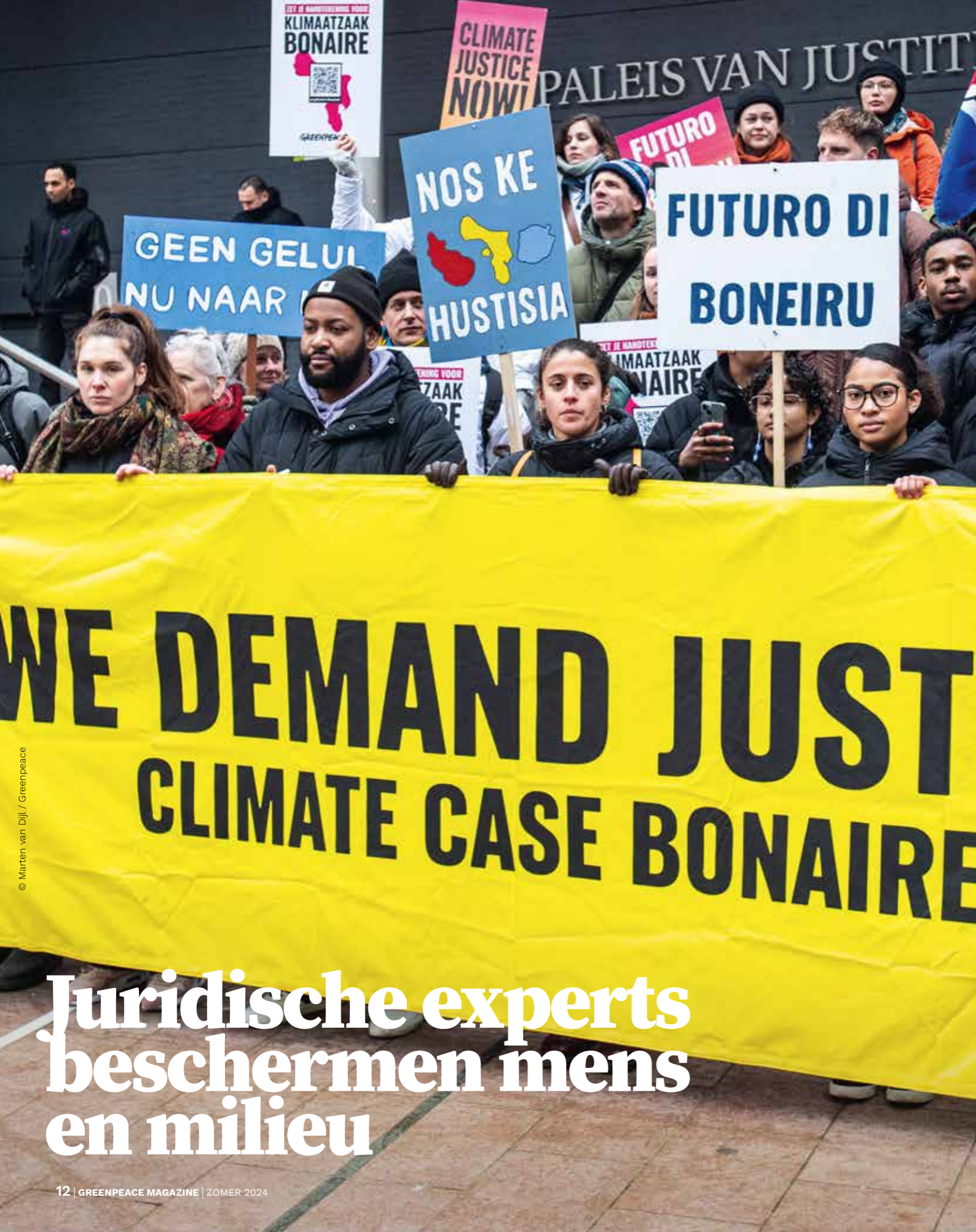
← Protestmars van het Torentje naar de rechtbank in Den Haag op 11 januari 2024, de dag waarop acht inwoners van Bonaire samen met Greenpeace Nederland de Nederlandse Staat dagvaardden.

Wat doe je als politici en bedrijven zich niet houden aan internationale verdragen en burgers blootstellen aan de gevolgen van de klimaatcrisis en natuurverwoesting? Dan stap je naar de rechter. Greenpeace maakt al vele jaren gebruik van de rechtspraak om verandering af te dwingen. Maar onze juridische experts beschermen ons ook tegen aanvallen van grote vervuilers.