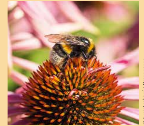
In Nederland zijn al 8 van de 29 hommelse soorten uitgestorven.

Meedoen? Ga dan naar act.gp/natuurzaak-gpm , laat uw naam achter en doneer eenmalig € 1. Natuurlijk houden we u als medestander op de hoogte van de voortgang van de rechtszaak en laten het weten als u nog meer kunt doen voor de Nederlandse natuur.