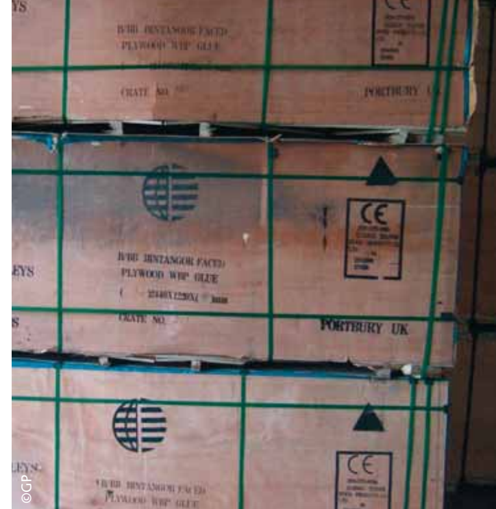
Bintangor multiplex bij het bedrijf Hoek Lopik.