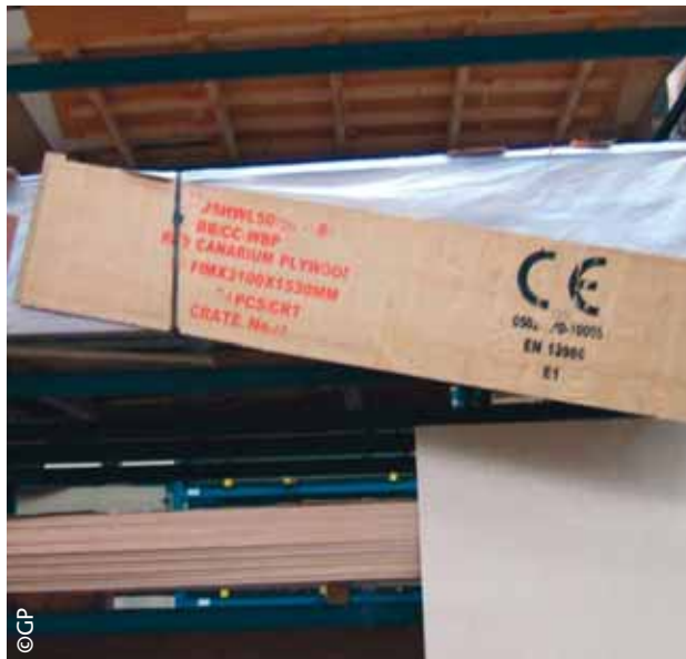
Red canarium multiplex in het magazijn van Oldenboom.