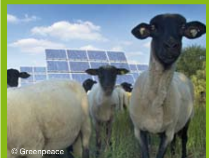
Ökostrom: Haben Sie schon gewechselt?

Vous n'avez pas encore changé pour l'électricité verte ? Rien de plus simple ! Contactez-nous ou informez-vous auprès des fournisseurs d'électricité verte au Luxembourg :