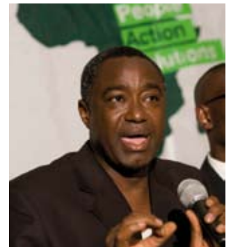
Amadou Kanoute, Direktor von Greenpeace Afrika

Trotz großer Konflikte im östlichen Teil des Landes hielt Greenpeace an der Eröffnung eines Büros in der Demokratischen Republik Kongo fest. „Seit vielen Jahren schon arbeitet Greenpeace in der DRC, und wir haben abscheuliche Tragödien aus erster Hand gesehen. Das soll aufhören. 40 Millionen Menschen sind vom kongolesischen Regenwald abhängig. Das heißt, sie wohnen mit, durch und in diesem Wald. Wir müssen ihren Lebensraum verstärkt schützen. Durch die globale Klimakrise ist es zudem unumgänglich, dass sich die internationale Gemeinschaft für den Forest-for-Climate-Mechanismus ausspricht“, sagt Amadou Kanoute, Direktor von Greenpeace Afrika.