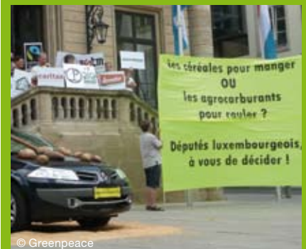
11. Juni 2008, 15 Organisationen aus Umweltschutz und Entwicklung protestieren vor der luxemburgischen Abgeordnetenversammlung gegen Agrokraftstoffe.