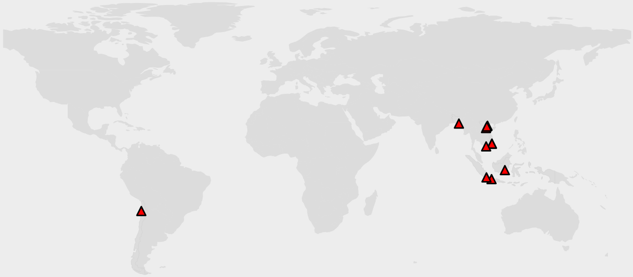
그림: 한국 공적 금융기관의 투자를 받는 해외 석탄화력발전소 사업의 위치 (2013년 1월부터 2019년 8월 기준)