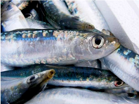
Sardine ( Sardina pilchardus )