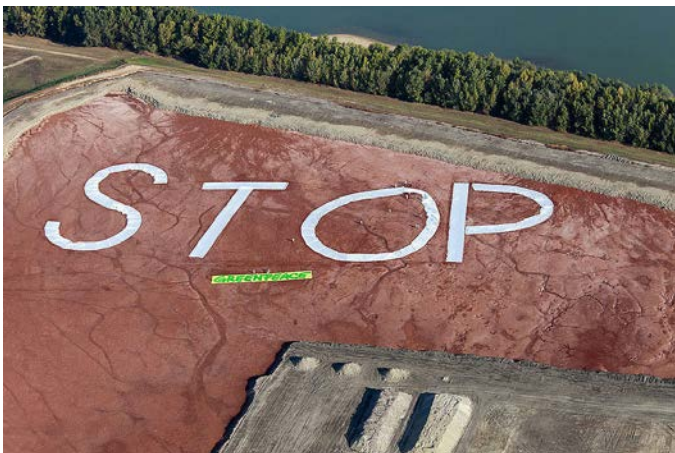
A kép egy 2011-es eseményen készült.

Kilenc év munkájával elértük, hogy egy olyan új engedélyt adjanak ki az almásfüzitői vörösiszap-tározóra , amely szigorú határértéket szab a bejövő hulladékokra, továbbá a behozható hulladékok körét is szűkíti. 2011 óta folyamatosan jogvitában álltunk a tározó üzemeltetőjével és a hatóságokkal azt követelve, hogy a Duna mellett működő veszélyes hulladékokat befogadó üzem ne működhessen úgy, hogy közben óriási környezeti kockázatot jelent. Az új engedélyt üdvözlöttük, de álláspontunk továbbra is az, hogy elsősorban a veszélyes hulladék keletkezését kell megelőzni, a keletkezett hulladékot pedig mindenhol a környezetvédelmi szempontból legszigorúbb normák szerint és a legkörülbíróbb módon kell hasznosítani, ártalmatlanítani vagy lerakni.