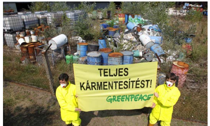
A kép egy 2016-os eseményen készült.

Több éves kitartó munkával elértük, hogy az adóhatóság végre közbeszerzést írt ki a Kiskunhalas külső részén található elhagyott veszélyeshulladék-telepen lévő, körülbelül ezer tonnányi hulladék elszállítására. Helyi civil szervezetekkel közösen 2016-ban tártuk fel, hogy Kiskunhalas külső részén, a lakóházaktól 100-150 méterre található ingatlanon nagyobb műanyag tárolókban és kisebb fémhordókban veszélyes hulladékok (festékek, olajok, oldószerek, savak, vegyszerek) vannak, a hordók és tárolók egy része megrongálódott, kiszakadt. Négy éven keresztül rendszeresen végeztünk méréseket a helyszínen, és akciókkal hívtuk fel a figyelmet a veszélyre. Azonban továbbra is hangsúlyozzuk: a hulladékok elszállítása mellett fontos, hogy a teljes körű kármentesítés is elkezdődjön, és ne maradjon szennyezés a talajban.