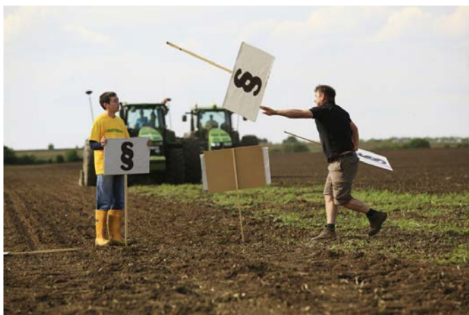
A kép 2014-ben készült.

A Fővárosi Törvényszék jogerős döntése alapján Kishantos és a Greenpeace Magyarország 2020. október 8-án pert nyert a magyar állammal szemben . A magyar biogazdálkodás fellegvárának számító kishantosi ökolgazdaság kálváriája 2013-ban indult, amikor egy jogszabályokat sértő eljárás során a gazdaság elveszítette a földjeit. Mi a biogazdaság elpusztítása ellen demonstráltunk békésen 2014-ben, amiért az állam pert indított ellenünk. Az eljárás öt éven át zajlott, ebből négy évig halasztották. A perben a magyar állam valótlan vádak alapján 14 millió forintot és ennek kamatait akarta megfizettetni szervezetünkkel és a Kishantosi Vidékfejlesztési Központtal. 2013 óta folyamatosan támogatjuk Kishantos harcát az igazságért, erről egy idővonalat is készítettünk .