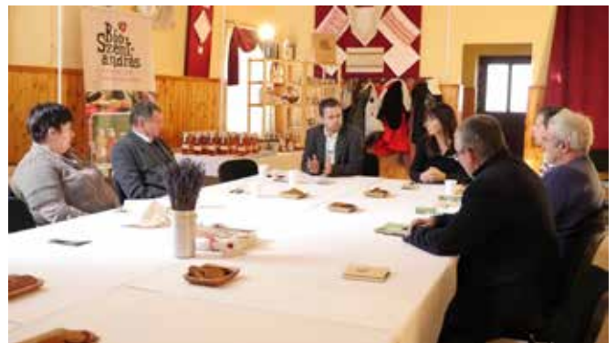
Kép a videóból

Öko-gazdálkodás mint a kisteleplések kiterjesztési lehetősége, bioszentandrás tapasztalatok