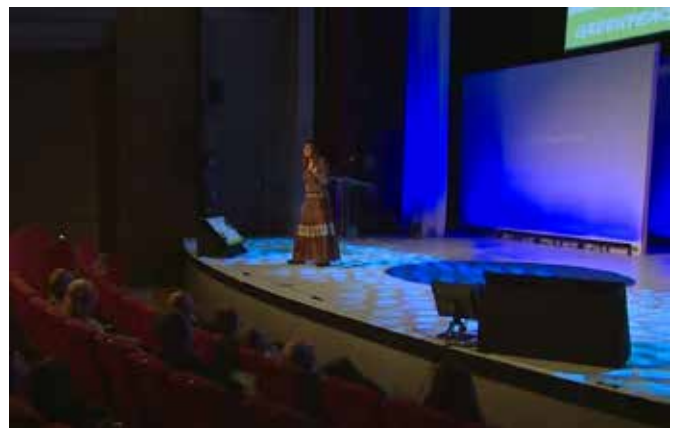
Kép a videóból