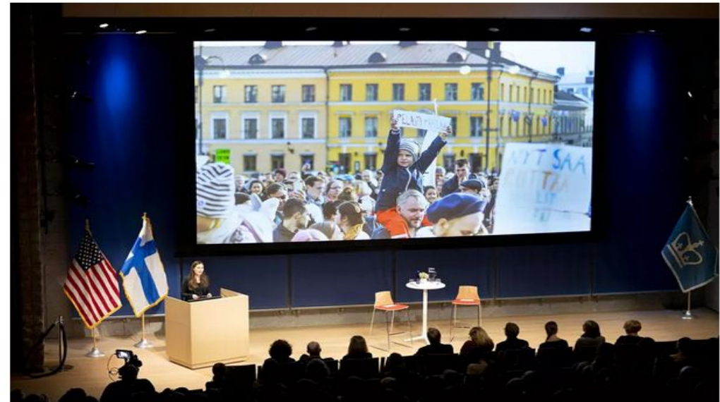
Esitystä tahdittivat valokuvat Suomesta.

Kiitos pääministerin medianäkyvyyden Suomi pääsee nyt kertomaan viestiään maailmalle ja maailmalla moni haluaa kuulla.