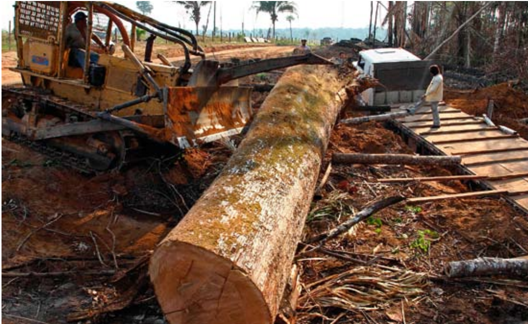
Tora de castanheira: apesar da autorização do IBAMA, fomos impedidos por madeireiros de retirar da floresta a árvore queimada.