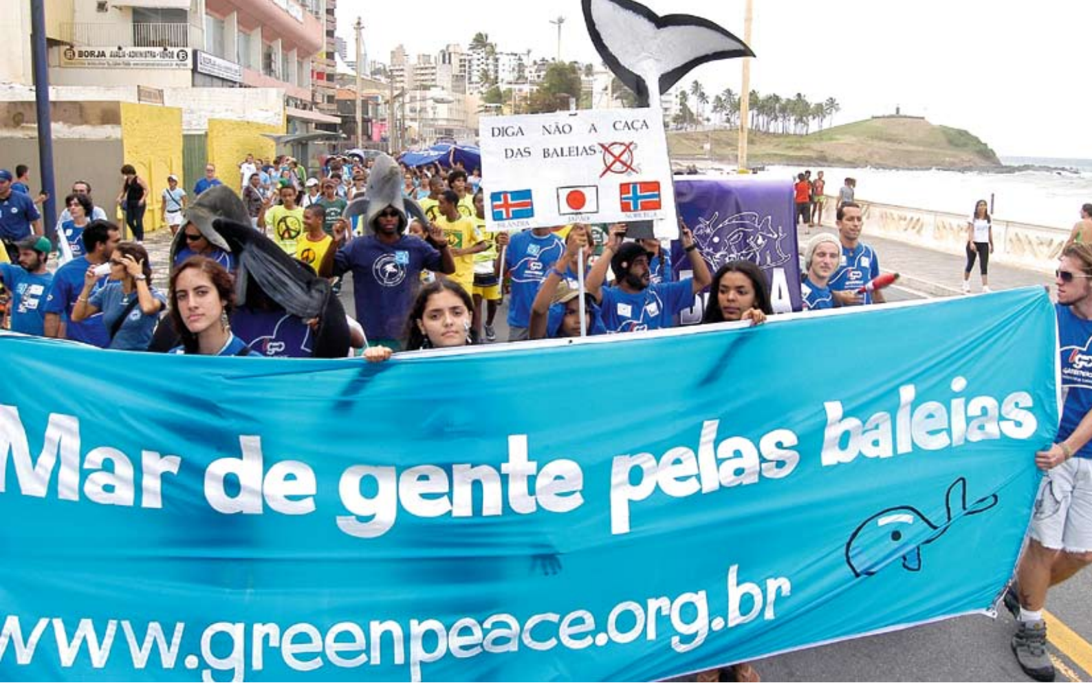
Vestindo azul, mais de 700 pessoas caminharam em Salvador, ao som do Olodum Mirim