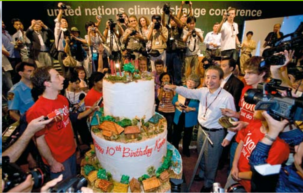
Centenas de balões sobem aos céus de Brasília com cinzas da floresta. | © Greenpeace/Bento Viana Bolo na Conferência do Clima, em comemoração aos dez anos do Protocolo de Kyoto. | © Greenpeace/Paul Hilton