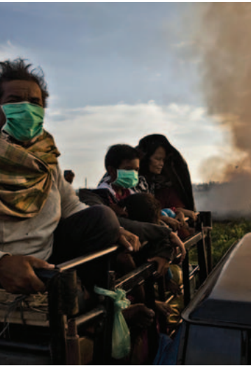
Juin 2013, province de Riau Des habitants se protègent derrière des masques en traversant le nuage de fumée causé par les feux de tourbières. Ces incendies permettent de défricher la terre pour faire place à des plantations de palmiers à huile.