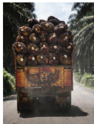
Mai 2013, province de Riau

Même au sein des membres de la RSPO, l'huile de palme non durable reste donc la règle. Les normes de la RSPO sont inadaptées et mal appliquées, et elles ne garantissent pas aux entreprises que l'huile qu'elles achètent soit issue d'une fabrication responsable.