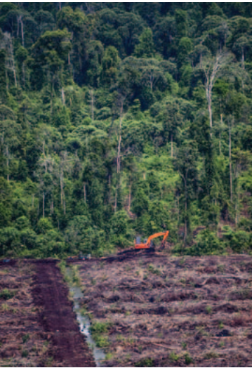
Mai 2013, province de Riau Ce bulldozer est à pied d'œuvre en lisière de la forêt tropicale, sur des tourbières récemment défrichées de la concession PT. Bertuah Aneka Yasa (groupe Duta Palma).