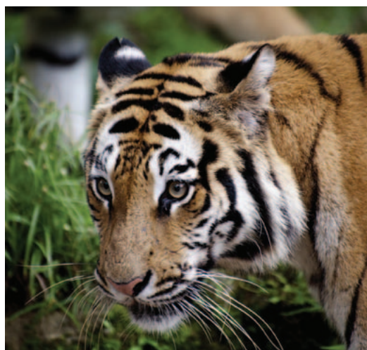
Mars 2013, tigre de Sumatra

Certains producteurs montrent le bon exemple. Parmi les entreprises qui ont « dépassé » les normes de la RSPO et adopté des politiques garantissant la protection des forêts, on trouve Golden Agri-Resources 50 , New Britain Palm Oil 51 et Agropalma 52 . Leur engagement en faveur de la lutte contre la déforestation montre qu'un secteur de l'huile de palme responsable est possible. En parallèle, des entreprises utilisatrices d'huile de palme sont en train de mettre au point des politiques d'achat responsables. Par exemple, le groupe Nestlé s'est clairement engagé à briser le lien entre huile de palme et déforestation au sein de sa chaîne d'approvisionnement. Toutefois, il est important de surveiller de près la mise en œuvre de ces politiques.