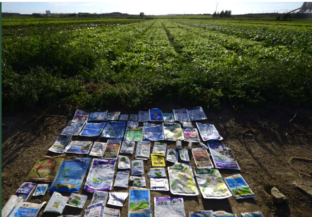
アスパラガスとレタスの畑から 拾い集めた、様々な農薬の袋 (中国・河北省)