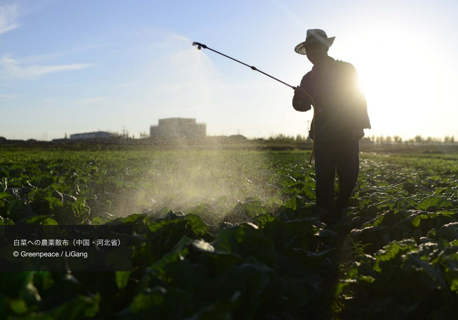
白菜への農薬散布（中国・河北省）