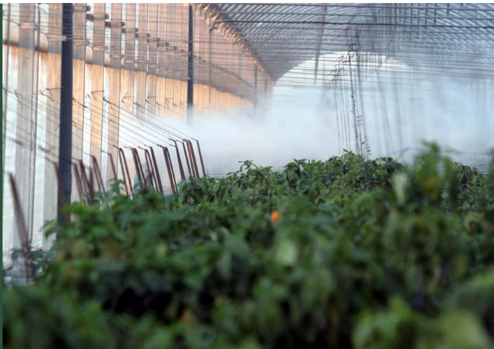
温室栽培の野菜への農薬散布 (スペイン)