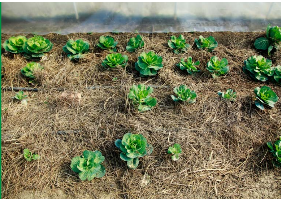
ハンガリーの有機農場の野菜

健康と生態系に悪影響を及ぼす農薬は幅広く、多様に存在するため、選択した農薬の使用を単純に減らすという戦略だけでは、人の健康を守ることはならない。工業型農業からの移行に伴い、合成農薬の使用を全廃し、生態系農業を実施することが、これらのリスクを回避するために不可欠である。