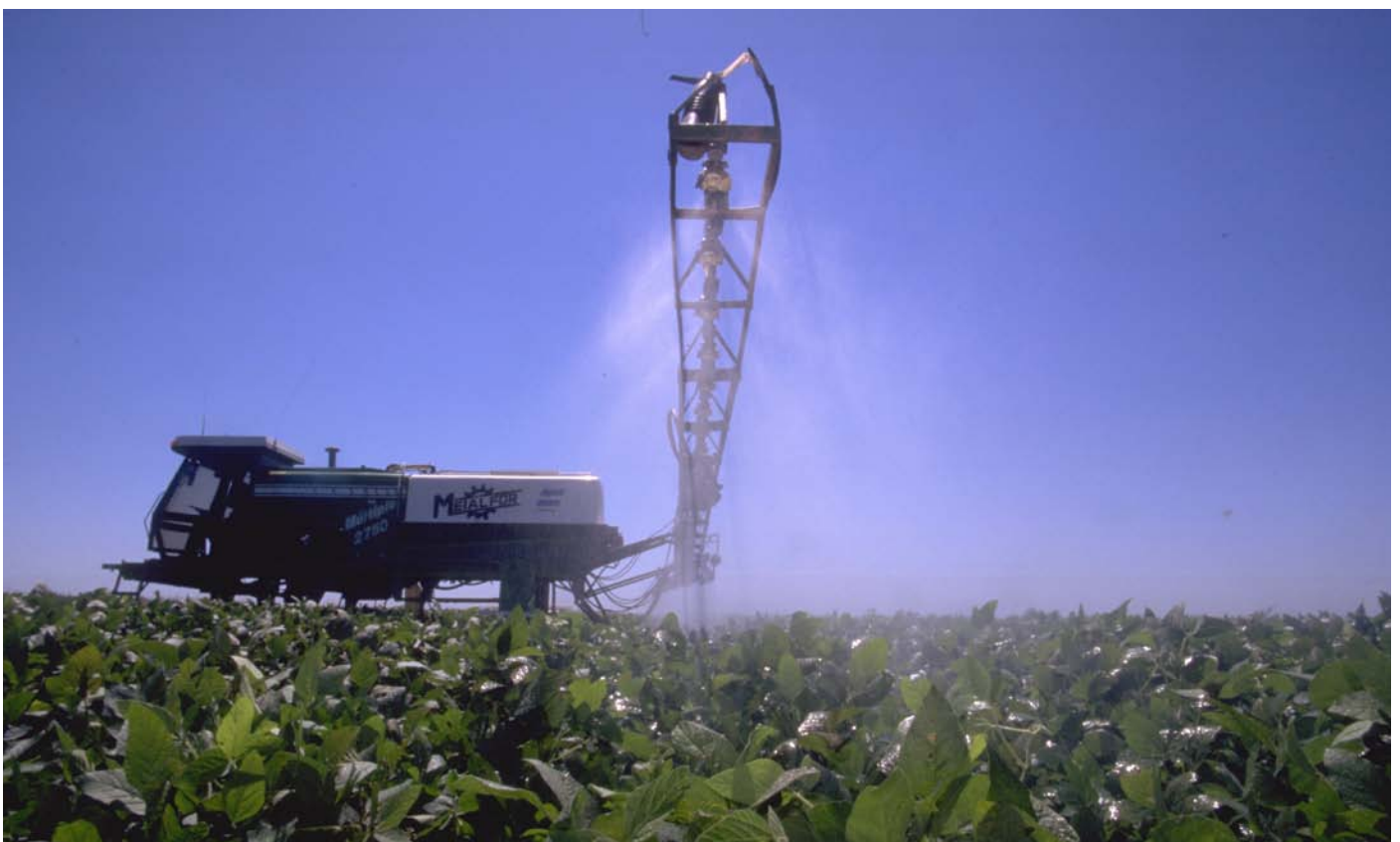
遺伝子組み換え大豆への農薬散布 (アルゼンチン)