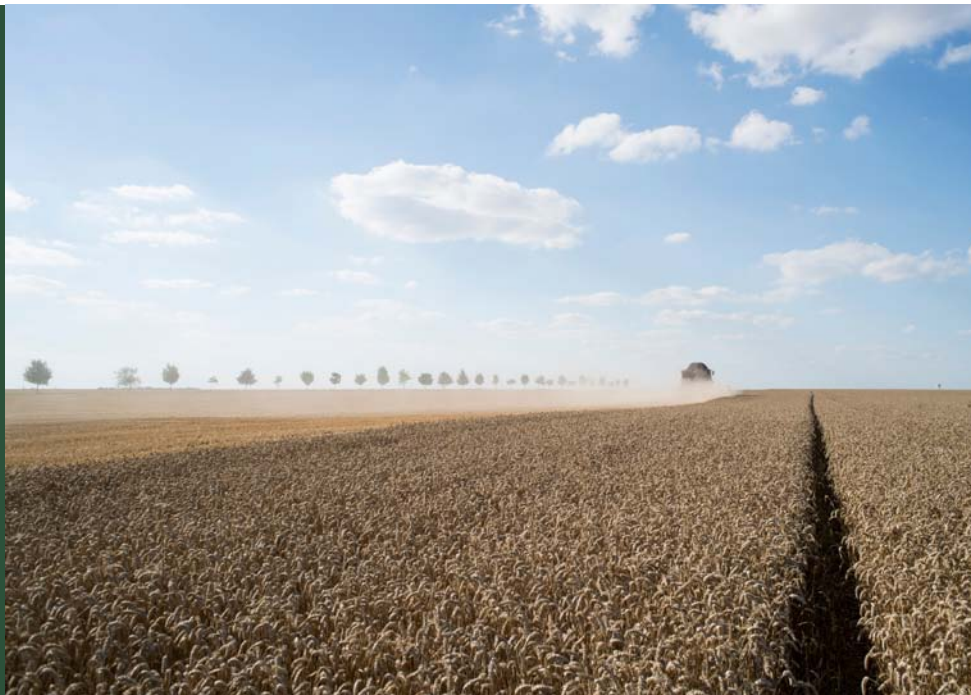
モノカルチャー（単一栽培）農業の景観（フランス）

このレポートでは、農薬の直接の使用だけでなくさらに広範な影響を含む両面から、農薬が及ぼす人の健康に対する脅威に重点を置いた。もちろん、現在の化学合成農薬への過剰な依存と、持続可能性のない工業型農業のシステムから生じる問題は、人の健康への脅威だけではなく、生態系への影響という面でも深刻である。