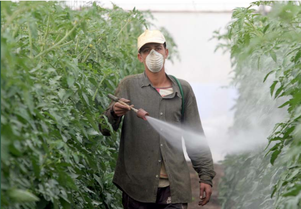
防護服を着けずマスクのみで、 温室内の野菜に農薬を撒く農業 労働者（スペイン）