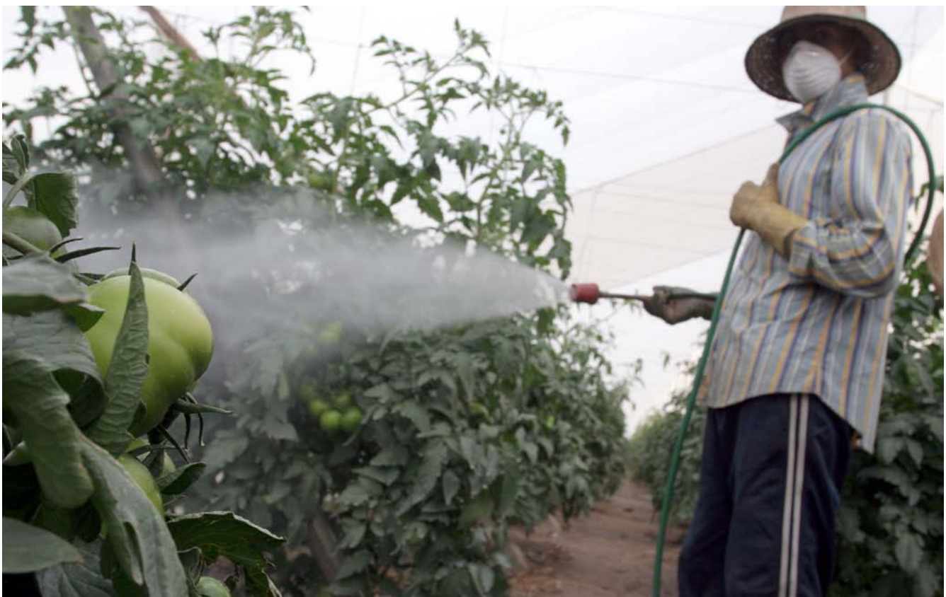
紙マスクをかけただけで防護衣を着けずに、温室内で野菜に農薬をまく労働者 （スペイン）

農業労働者の毛髪に残留農薬を調べた欧州の研究では、除草剤と殺菌剤を含む33種類の農薬が確認された。最も頻繁に検出された農薬はピリメタニル、シプロジニル、アゾキシストロピンであり、使用した農薬の種類や方法との間に相関関係があった。農場での担当作業の種類に関わりなく、全被験者で同等濃度のp,p'-DDEおよび \gamma -HCH（現在は使用されない）が検出され、環境中での残留性が高い有機塩素系への長期曝露が示された（Schummer et al. 2012）。