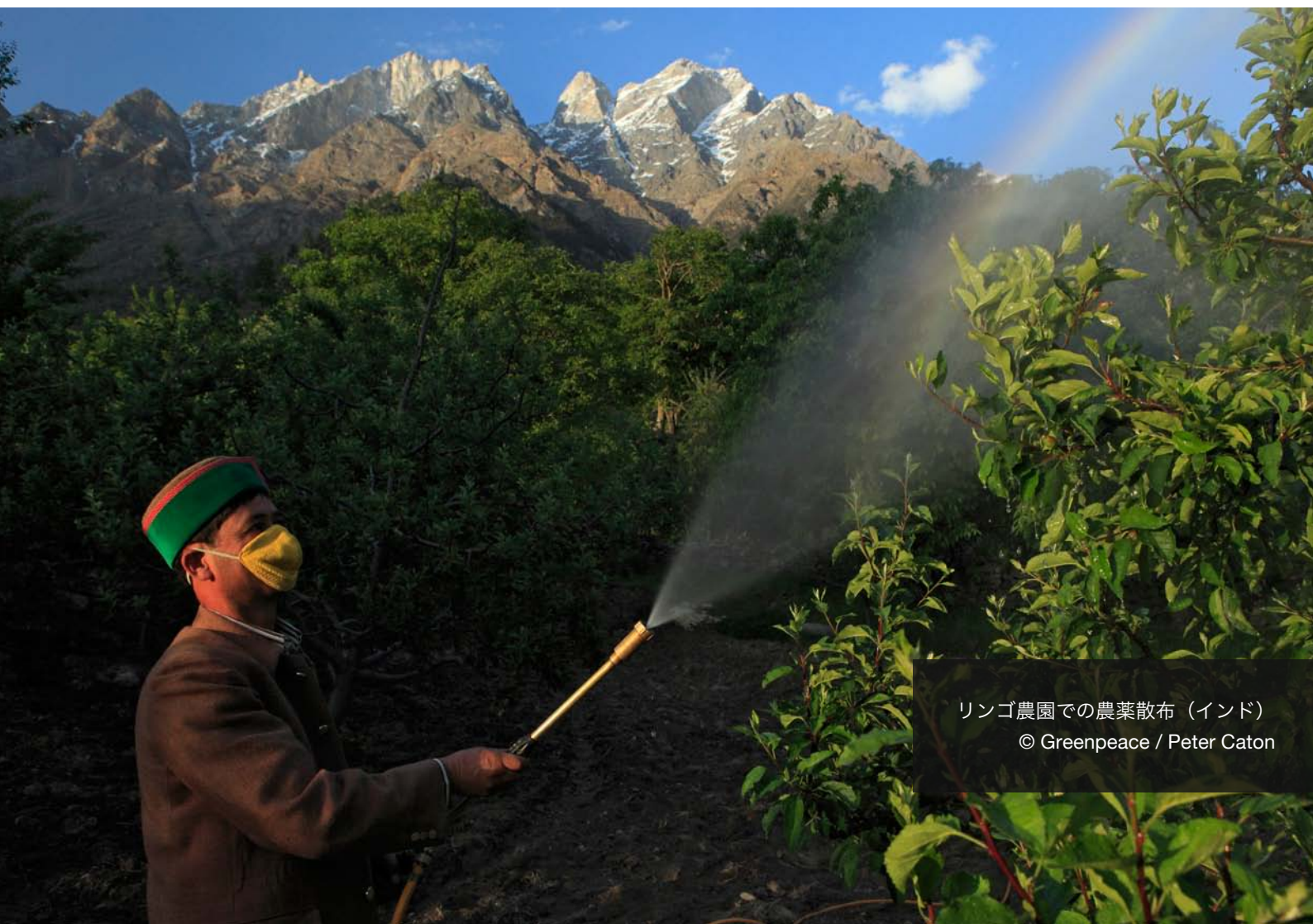
リンゴ農園での農薬散布（インド）