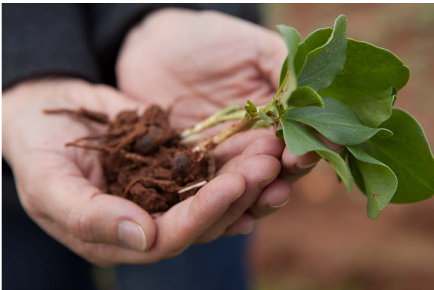
生態系農業で育てているそら豆 ギリシャの農産物の中でも主要なタンパク源作物

有害な農薬への曝露を減らすための唯一の確実な方法は、これまでよりも長期的視野に立ち持続的な食料生産方法への移行である。そのためには、標的ではない生物に対して有害なすべての農薬の段階的禁止を直ちに着手する法的拘束力のある協定を、国内レベルと国際レベルの両面で施行する必要がある。農業の在り方の抜本的改革には、化学物質の投入に強く依存する工業型農業から生態系農業（自然の生態系を保全し持続可能な環境保護型農業）の全面的な実施へと移行すること、すなわち、生態系農業を人間の食料供給および私達が生存する生態系を守るための唯一の手段とするというパラダイムシフトが必要である。生態系農業は、有害な化学物質に依存せず、健康的で安全な食料を供給する、現代的かつ効果的な農業の方法である。