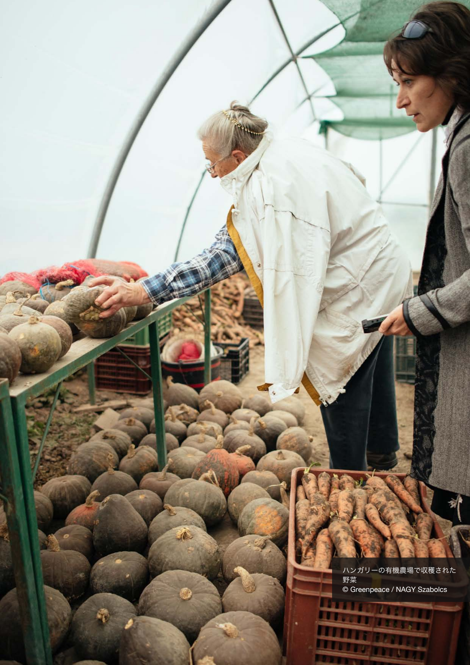
ハンガリーの有機農場で収穫された 野菜