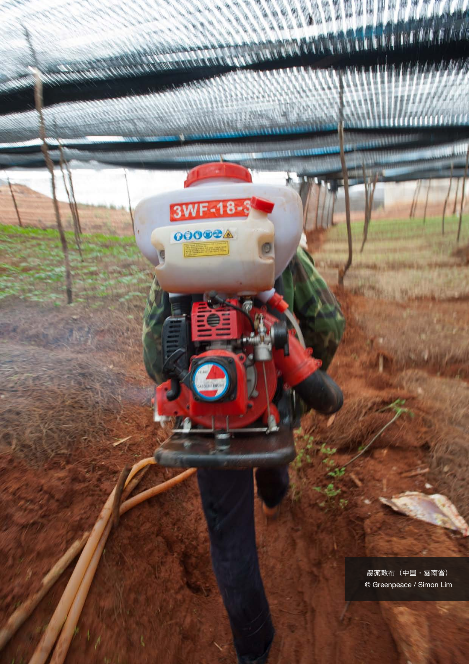
農藥散布 (中国·雲南省)