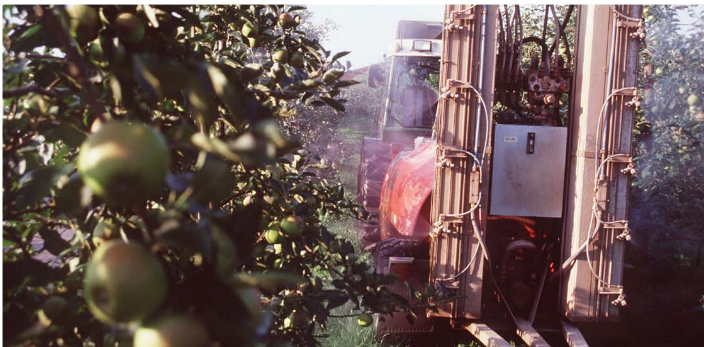
リンゴの大規模農園での農薬散布（ドイツ・ハンブルク近郊）

養鶏と鶏卵生産ではしばしば、ワクモなどの外部寄生生物の駆除に殺虫剤と殺ダニ剤を使用する。その結果、これらの農薬の一部は筋肉、脂肪、肝臓に蓄積し、他の組織から農薬が排出されてからかなりの時間が経過した後も、卵から検出されることがある（Schenck and Donoghue 2000）。