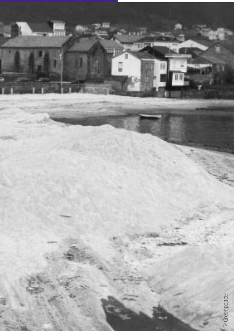
Regeneración artificial en la playa de Villa de Muros, A Coruña.

Desde el punto de vista costero, podemos afirmar que Galicia vive de espaldas al mar. Uno de los ejemplos más visuales de esta actitud lo encontramos en la costa ártabra, donde se construye actualmente el puerto exterior de Ferrol, adosado a un Lugar de Importancia Comunitaria (LIC) de la Red Natura 2000 europea "Costa Ártabra", sin que esto parezca importar a nadie.