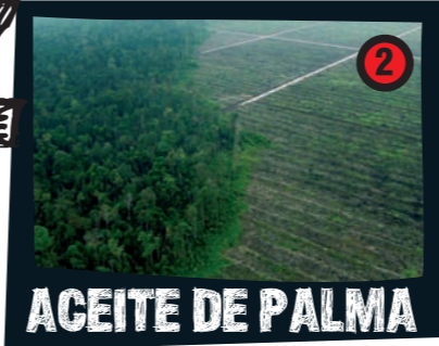
ACEITE DE PALMA

Grandes corporaciones de la alimentación y la cosmética están incrementando la utilización de ACEITE DE PALMA como ingrediente para elaborar muchos de los productos que usamos habitualmente. También para biocombustibles.